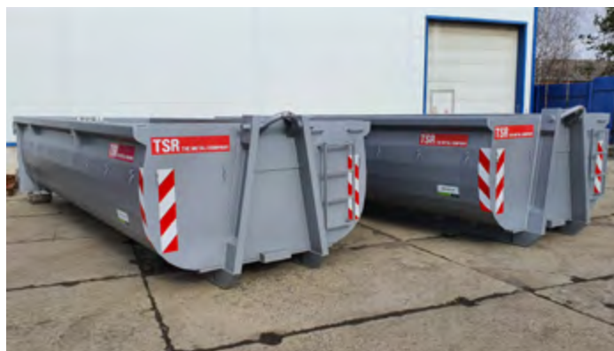
ABR-HBI cu volum de 18 m 3