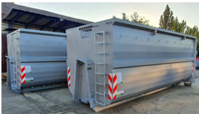
ABR-HBI cu volum de 36 m 3